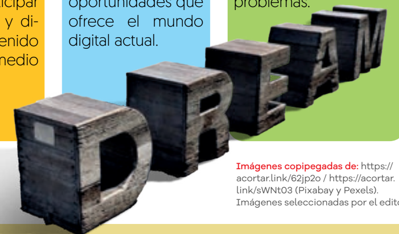
Imágenes copipegadas de: https://acortar.link/62jp2o / https://acortar.link/sWNt03 (Pixabay y Pexels). Imágenes seleccionadas por el editor.

El idioma inglés tiene un gran valor como herramienta de movilidad social y desarrollo personal. Dominar este idioma amplía las posibilidades de estudio y trabajo en el extranjero, lo que a su vez puede enriquecer nuestra experiencia de vida y ampliar nuestras perspectivas. Además, el proceso de aprendizaje de un nuevo idioma conlleva beneficios cognitivos significativos, como el fortalecimiento de la memoria, la concentración y la capacidad de resolución de problemas.