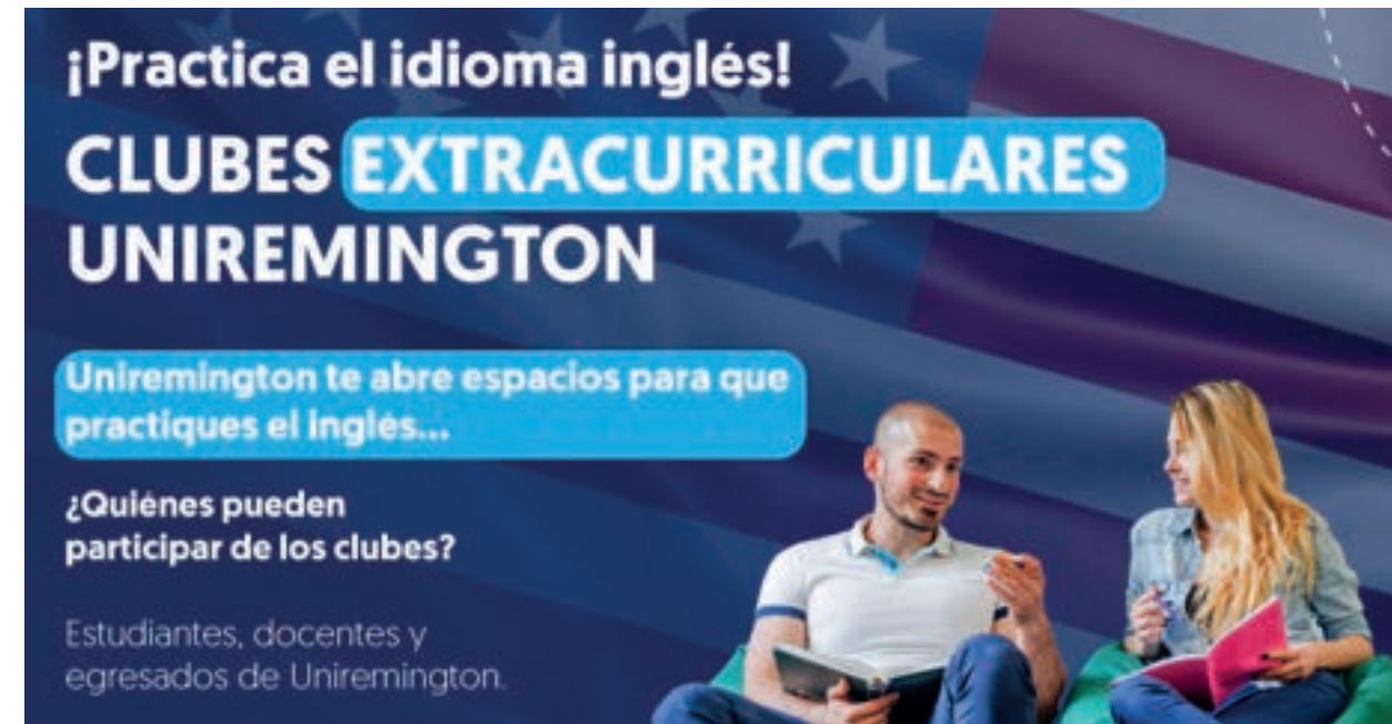
Imágenes seleccionadas por el editor.

En general, el objetivo final de la Política de Segundo idioma en Uniremington es equipar a los estudiantes de la Institución con las habilidades y competencias lingüísticas, culturales y sociales necesarias para sobresalir en un mundo cada vez más interconectado y competitivo.