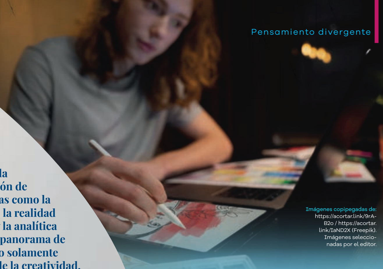
Imágenes seleccionadas por el editor.