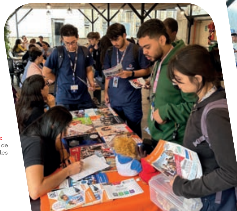
Imágenes: ediciones de promocionales diseñados por la Dirección de Mercadeo de Uniremington.