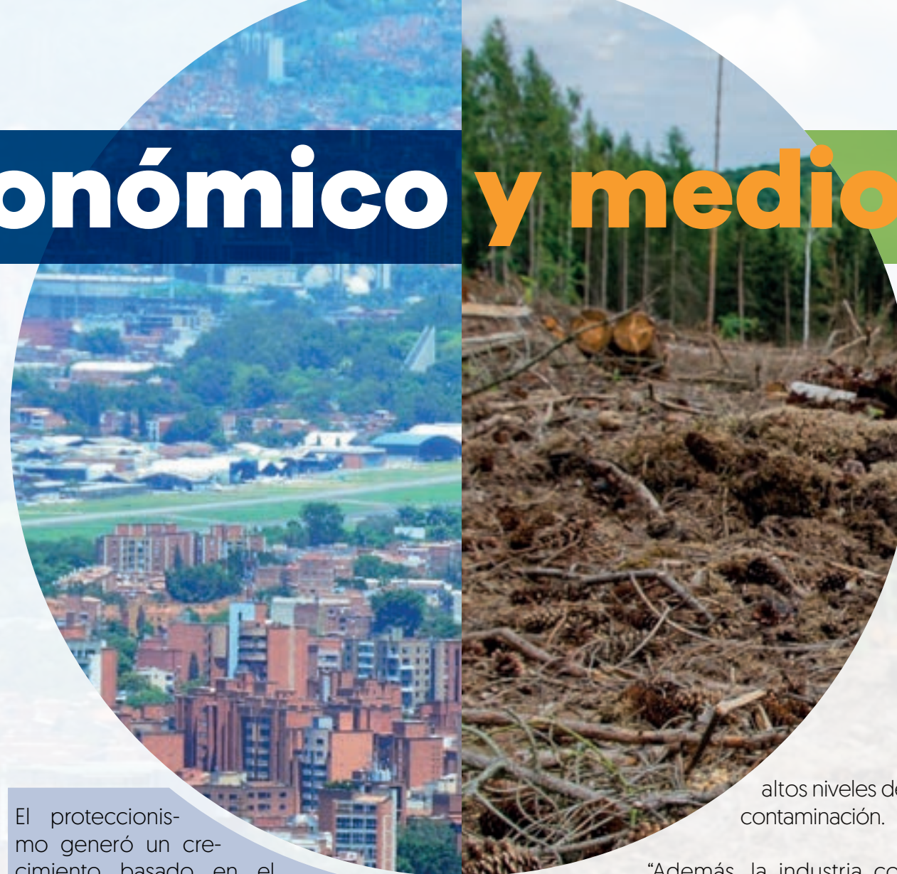
altos niveles de contaminación.

Por lo anterior se puede afirmar que el proteccionismo alentó en Colombia la reutilización de tecnologías caducas de otros lugares, generando un crecimiento acelerado en las emisiones atmosféricas, el aumento de desechos altamente tóxicos, vertimientos de aguas residuales y, en general, un uso inadecuado del medioambiente y los recursos naturales derivando en