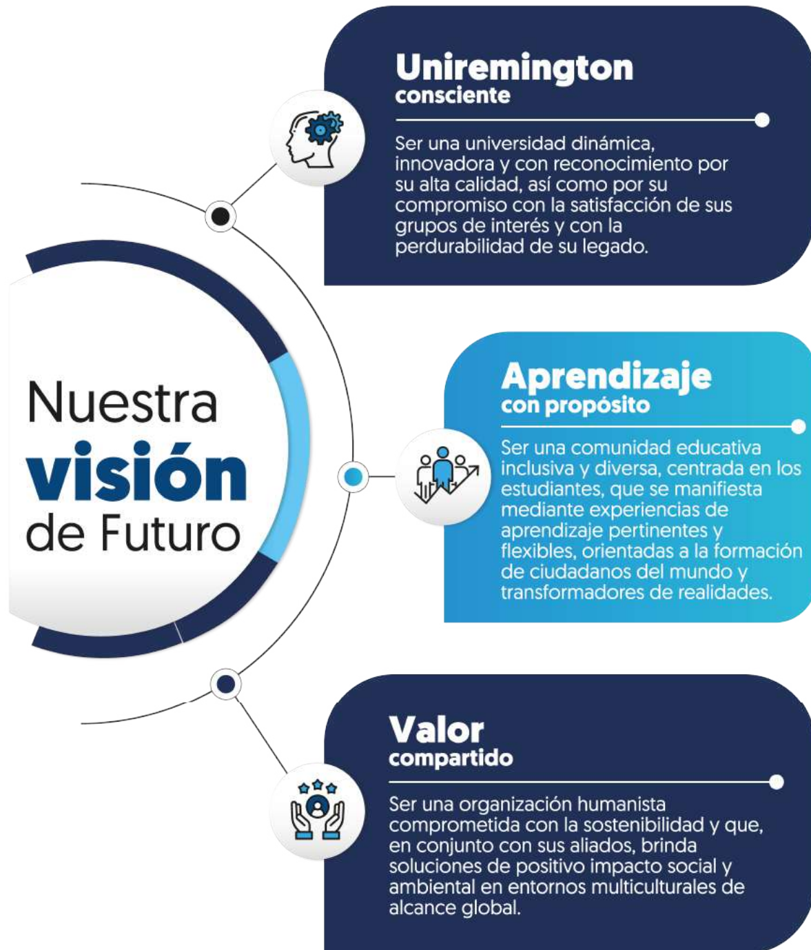
Figura 2. Propósito Superior y Visión Institucional

Fuente. Plan de Desarrollo Institucional 2024