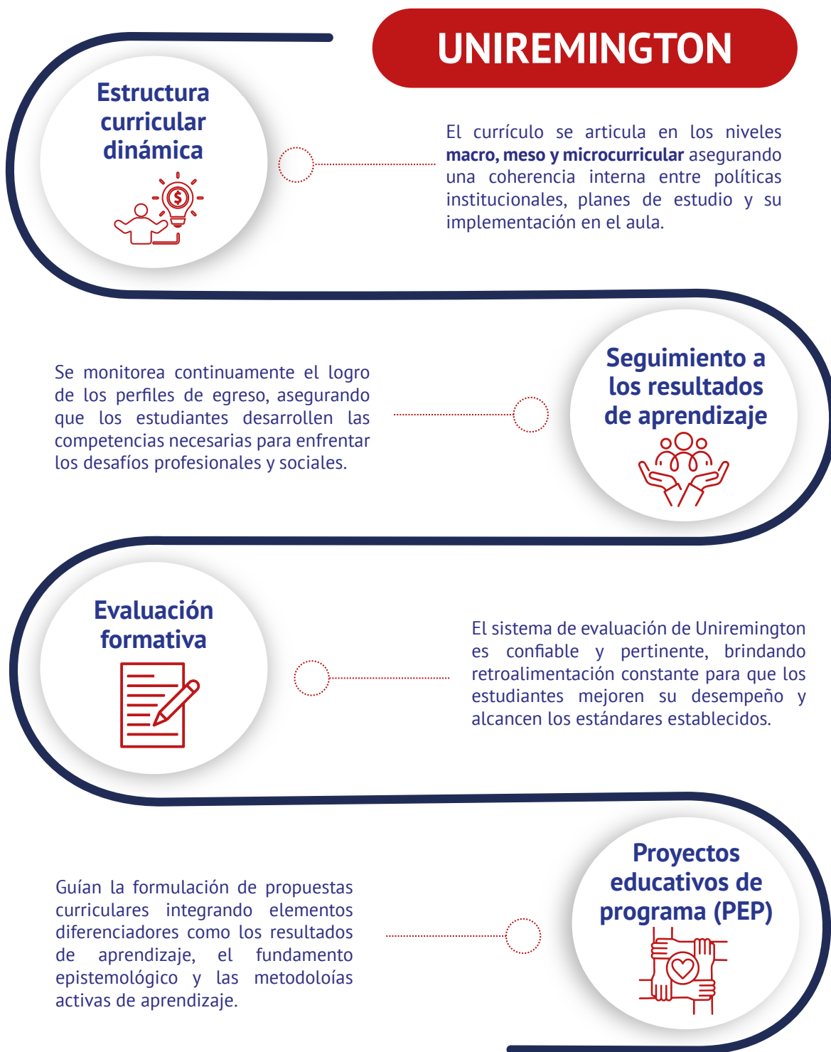
Figura 6. Alineación y flexibilidad para la formación integral