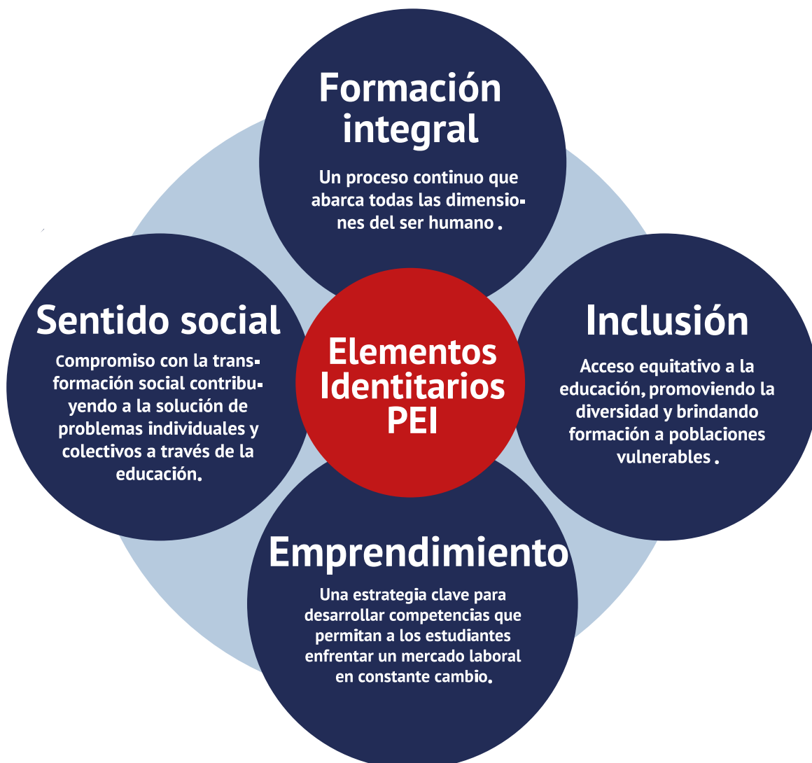
Figura 5. Elementos identitarios Proyecto Educativo Institucional.

implícito e explícito, que se establece mediante sus objetivos a lo largo de su historia. Precisamente, entre los elementos más importantes del propósito superior, además de la formación integral, se resalta el sentido social, de tal modo que le permita contribuir a la solución de los problemas de los individuos y de la sociedad en general.