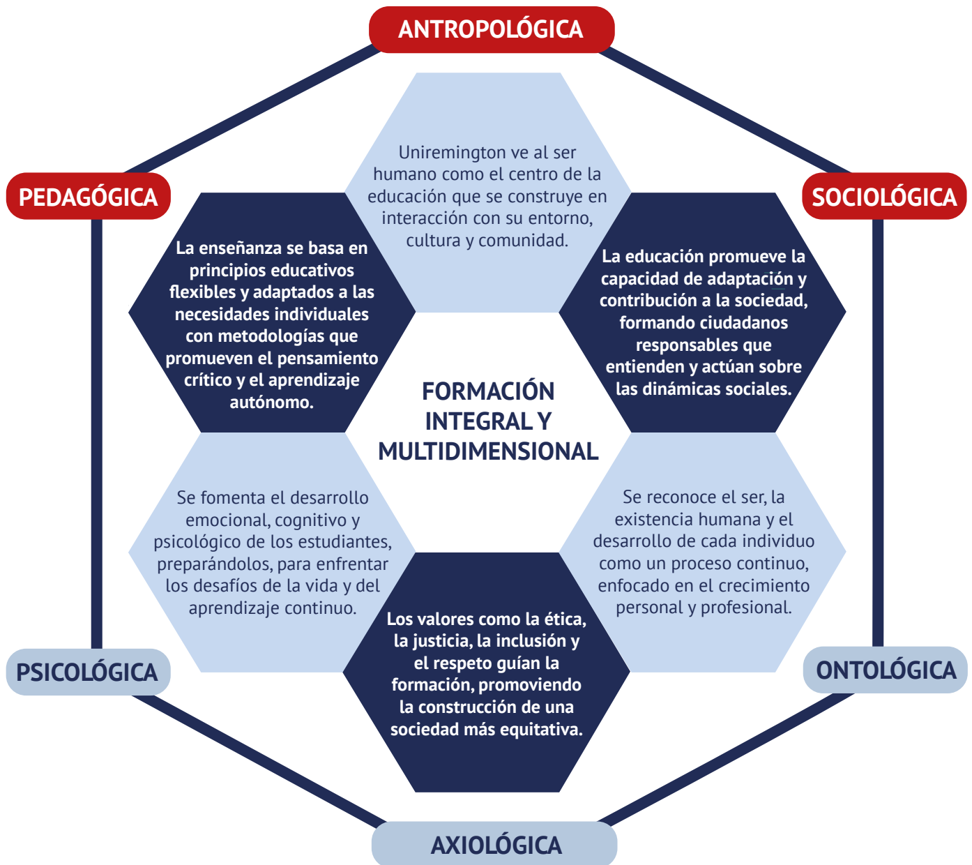
Figura 4. Visión filosófica para una formación integral y transformadora.